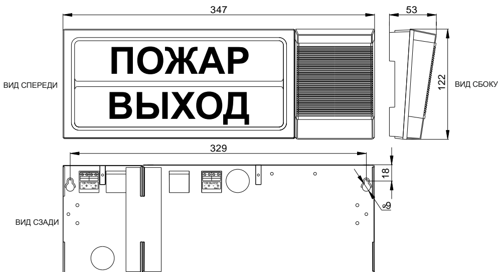
Рис.1 Внешний вид, габаритные и установочные размеры корпуса оповещателя

Оповещатель изготовлен в пластмассовом корпусе. Внешний вид оповещателя, габаритные и установочные размеры показаны на рисунке 1.