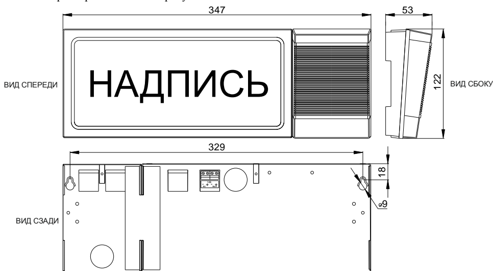
Рис.1 Внешний вид, габаритные и установочные размеры корпуса оповещателя

Оповещатель изготовлен в пластмассовом корпусе. Внешний вид оповещателя, габаритные и установочные размеры показаны на рисунке 1.