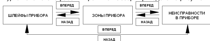
Рисунок 2 - Структурная блок-схема работы ВПИУ-А16 в режиме «Обзор»

Структурная блок-схема работы в режиме «Обзор» приведена на рисунке 2.