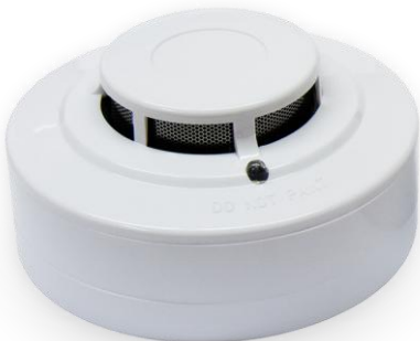
Рис. 1. Внешний вид извещателя

Извещатель конструктивно состоит из блока извещателя и розетки (см. рисунок 1).