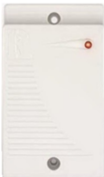
Рис. 1. Внешний вид корпуса ВКП спереди

ВКП состоит из корпуса и платы, установленной внутри корпуса. Внешний вид корпуса ВКП спереди показан на рисунке 1.